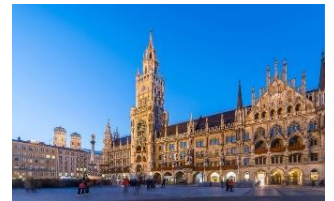
Marienplatz & Rathaus

Ob Sie sich vom Marienplatz aus 300 m südlich zum Viktualienmarkt oder 300m nördlich zur Residenz und der Feldherrenhalle wenden: Münchens zahlreiche Sehenswürdigkeiten und Einkaufsmöglichkeiten liegen alle dicht beieinander. Auch das Isarufer und das Maximilianeum sind nicht mehr weit. Auch der ca. 2,5 km entfernte Englische Garten lädt zu einem netten Spaziergang im Grünen ein.