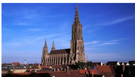
Das Ulmer Münster

Das Donauufer lädt zu ausgedehnten Spaziergängen ein. In ca. 10 Gehminuten haben Sie die Altstadt mit dem Ulmer Münster, dem höchsten Kirchturm der Welt, erreicht und in weiteren 10 Minuten sind Sie im Fischer- und Gerberviertel mit den malerischen Fachwerkhäusern.